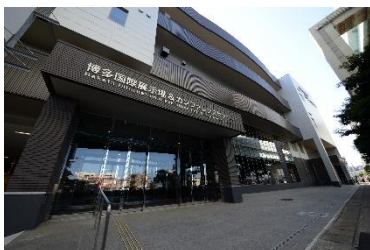
(博多国際展示場&カンファレンスセンター) 設置面積：3,232㎡ 発電容量：173kWp(DC) 年間想定発電量：200,813kWh 所在地：福岡県福岡市

まずは、2022年度を目途に、西鉄グループの施設である博多国際展示場&カンファレンスセンター、成田ロジスティクスセンター、九州メタル産業 第二ダスト倉庫へ太陽光発電設備を設置し、再生可能エネルギー電力を供給する予定です。