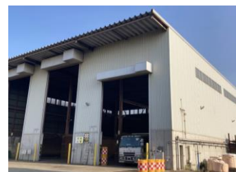
(九州メタル産業 第二ダスト倉庫) 設置面積：625㎡ 発電容量：77kWp(DC) 年間想定発電量：89,238kWh 所在地：福岡県北九州市