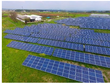
野立て太陽光発電設備