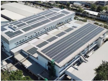
屋根上太陽光発電設備