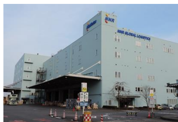
(成田ロジスティクスセンター) 設置面積：1,506㎡ 発電容量：117kWp(DC) 年間想定発電量：132,354kWh 所在地：千葉県山武郡